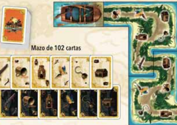
Mazo de 102 cartas