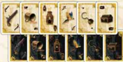
Mazo de 102 cartas