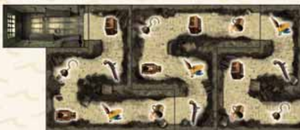
Tablero de calabozo