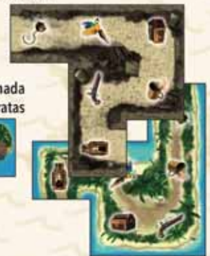
8 piezas de tablero